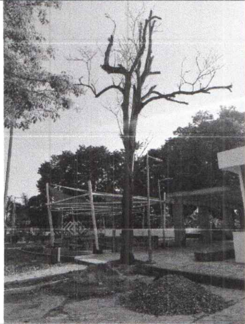
Figura 2. Vista frontal del árbol donde se logra apreciar la altura y ramas secas, rotas o parcialmente unidas al tronco.