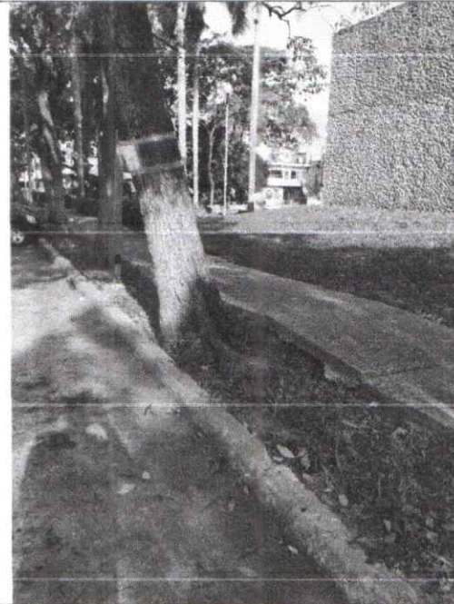
Figura 2. Vista de las raíces levantando la infraestructura de la banqueta.